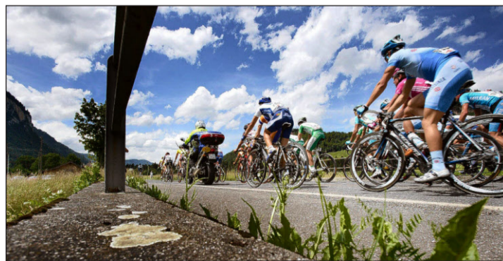
2007 fuhr der Tour-de-Suisse-Tross letztmals durch das Oberland (hier im Stockental). Im Juni 2010 ist Frutigen Etappenort.